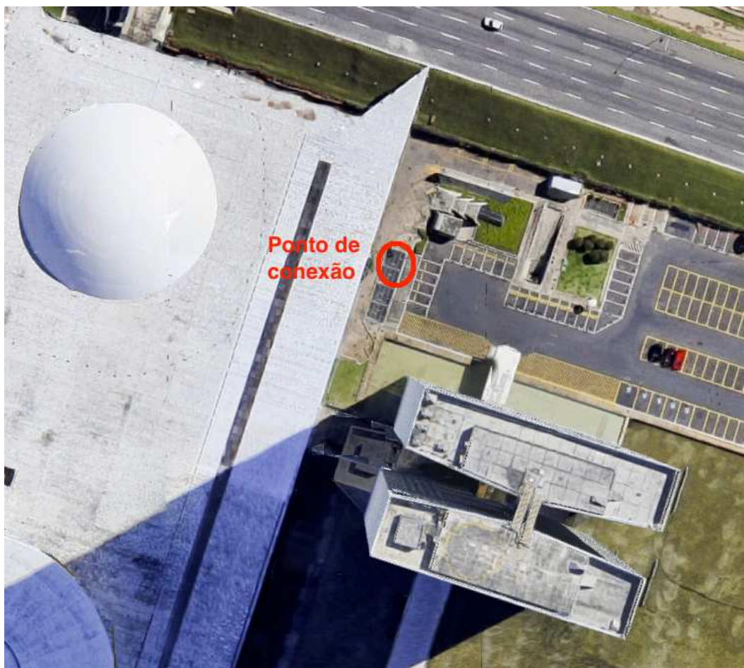
Figura 1: Ponto de conexão do gerador (Anexo I).