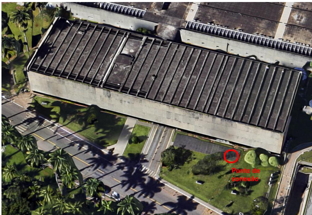
Figura 2: Ponto de conexão do gerador (Anexo II).