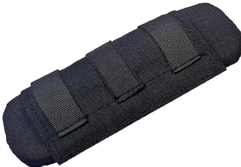
Figura 4 - almofada de proteção para ombros Imagem de Referência