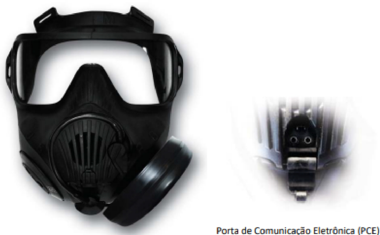
Figura 1 - Máscara Contra Gases Imagem de Referência

FILTRO COM PROTEÇÃO CONTRA LACRIMOGÊNEOS PARA MÁSCARA POLICIAIS CONTRAGASES , com capacidade de filtragem de partículas de 0,185 micrometro de diâmetro e maior do que 99,97%. Que ofereça no mínimo 24 horas de proteção contra a contínua exposição ao CS, CN, e OC. Deve ter um elemento de filtro de partículas excedendo os requisitos do NIOSH CBRN para proteção contra produtos químicos perigosos., o nível é incorporada, garantindo um desempenho eficaz contra poeiras, névoas, fumos. Deve ser compatível com a máscara.