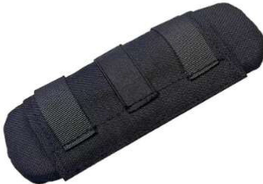
Figura 4 - almofada de proteção para ombros Imagem de Referência

2.6. Por dentro possuir duas divisórias de espuma forradas, dividindo o bernal transversalmente em três compartimentos, sendo o compartimento central (maior) com largura de 15 cm e os outros dois (menor) com largura 13,5 cm para acomodação de cartuchos calibre 37/40 mm de emissão lacrimogênea, conforme figura abaixo. As divisórias internas devem ter altura de 1 cm a menos que a altura da bolsa.