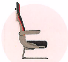
Gol + Conforto